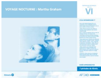
Version intégrale VOYAGE NOCTURNE : Martha Graham