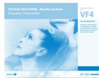
VF4 Évaluation / Rétroaction