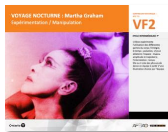
VF2 Expérimentation / Manipulation