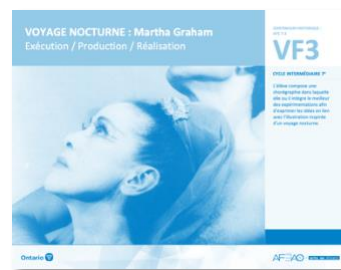
VF3 Exécution / Production / Réalisation