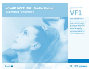
VF1 Exploration / Perception