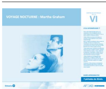
Version intégrale VOYAGE NOCTURNE : Martha Graham