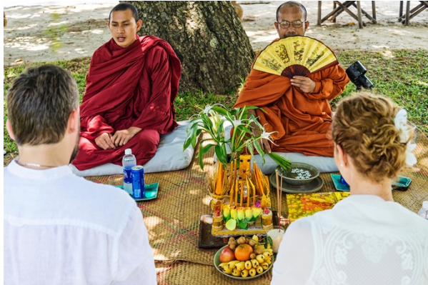
La visite des mariés bouddhistes avec les offrandes rituelles aux moines qui bénissent leur union.