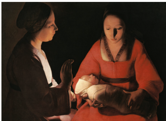
(Georges de La Tour - la fête de la nativité - Noël)

Ce sont des célébrations ou commémorations des événements marquants de la vie de Jésus, de sa naissance jusqu'à sa mort, sa résurrection et son ascension, ensuite la Pentecôte lorsque les apôtres reçurent le don de l'Esprit Saint pour continuer à répandre la Bonne Nouvelle de Jésus.