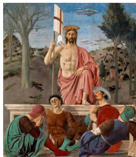
(Piero della Francesca - La résurrection - Pâques)